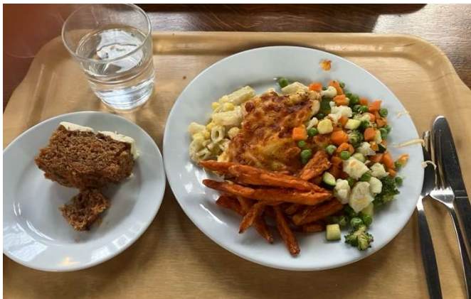
オックスフォード初日の夕飯。パスタ、ミックスベジタブル、スイートポテト、キャロットケーキ