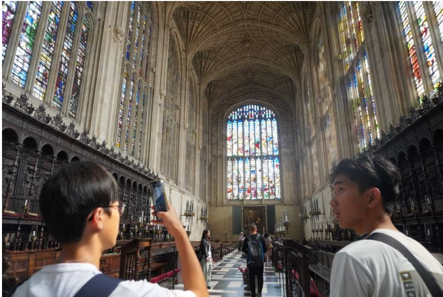
キングスカレッジのチャペルを観光する様子

最終日の午前中は、ケンブリッジ観光に充てられました。お土産を買う生徒、観光地に向かう生徒など時間の使い方はさまざまでした。