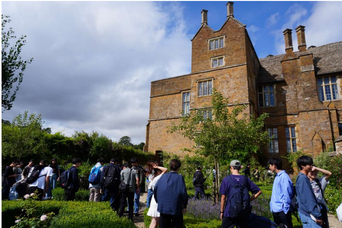
ガーデンを見学する生徒たち