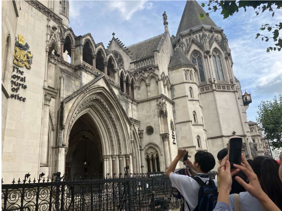
最高裁判所を撮影する生徒たち

第3セッションの初日に、English Legal Systemを選択していた生徒はロンドンの最高裁判所を見学に行きました。最高裁判所内では、ここで取材を30年ほど続けられてきたジャーナリストの方が案内してくださいました。写真撮影厳禁でしたので、建物内での写真はありませんが、非常に大きな建物で、それぞれのセクションでわかりやすく解説をしていただけました。