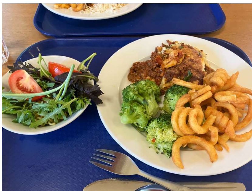
ケンブリッジ初日の夕飯