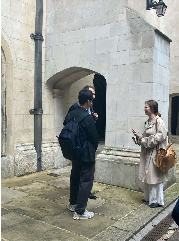
トーク後に直接法廷弁護士の方にお話しに行く生徒

午後は、法廷弁護士の方がいらして、法廷弁護士として働くことになった経緯や、仕事内容についてのトークをしてくださいました。