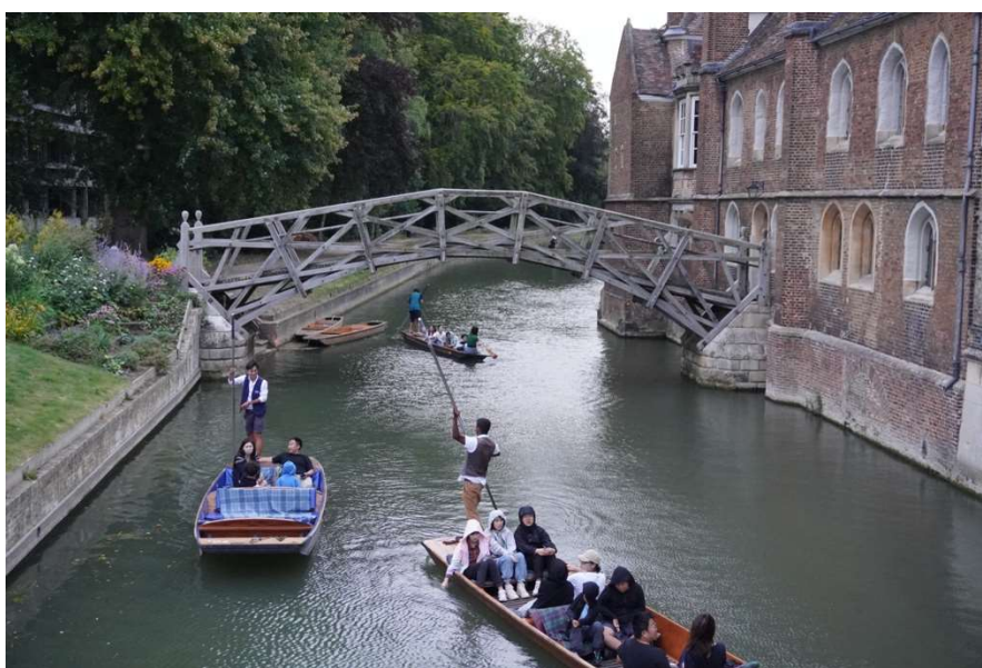
授業後の自由時間に、ケム川でパンティング（川底を棒で押して進む）をする生徒たち