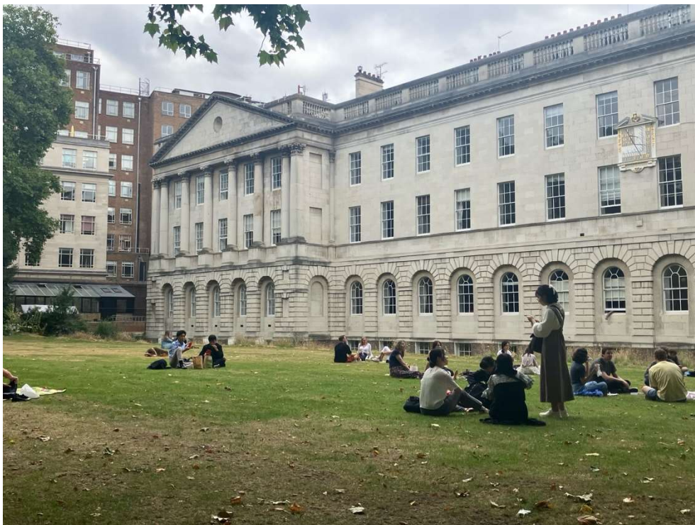
お昼ご飯は公園でピクニックをしました。