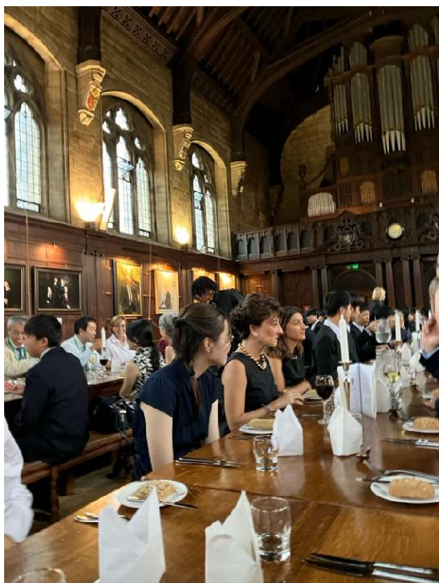
フォーマルの様子

順番が前後してしまいましたが、12日は第2セッション最終日であると同時にオックスフォードにいる最終日でもありました。Balliol College, Jesus College 両方の生徒さんたち、そして講義をしてくださった先生方も交えてフォーマルディナー（3コースディナー）で締めくくりました。なるべく講義を受けた先生のそばに座るとのことだったので、先生方と興味深いお話ができたのではないのでしょうか。