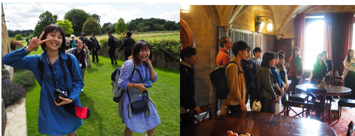
16:30 Broughton Castle 内の Caféでお茶